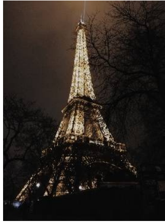
(Concurso de Fotografía Viaje a París 2019)